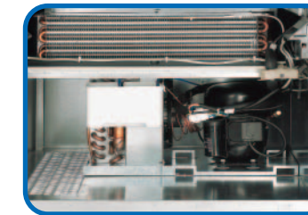
UNIDAD DE REFRIGERACIÓN DESLIZABLE

El modelo Rondò está dotado de un nuevo grupo de refrigeración deslizante de fácil extracción y con salida frontal del aire caliente (patentado). De este modo es posible poner el distribuidor contra la pared sin perjudicar la unidad de refrigeración,