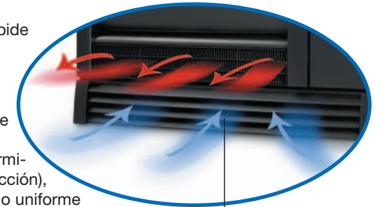
Salida frontal del aire caliente

Las bandejas inclinables para facilitar la carga de los productos pueden ser transformadas con facilidad en fijas mediante la introducción de un pequeño inserto de metal (patentado) que impide su posibilidad de reclinarsse.